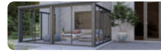
60-010-0113 AZUR YEŞİL