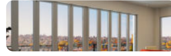
60-B906-0516 PARLAK GÜMÜŞ