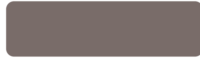
60-706-0216 BEJ GRİ