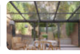
60-010-0113 AZUR YEŞİL